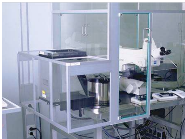
MEVM für Mikroskop – MEVM for microscope