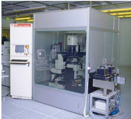
Equipmenteinhausung - Minienvironment