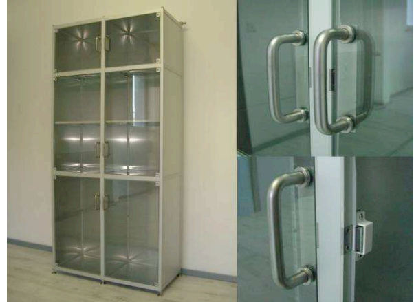
N2-Spülschrank / rinsable storage