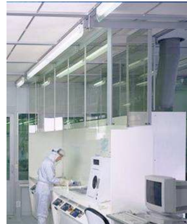
Luftleitschürze – air guide plate