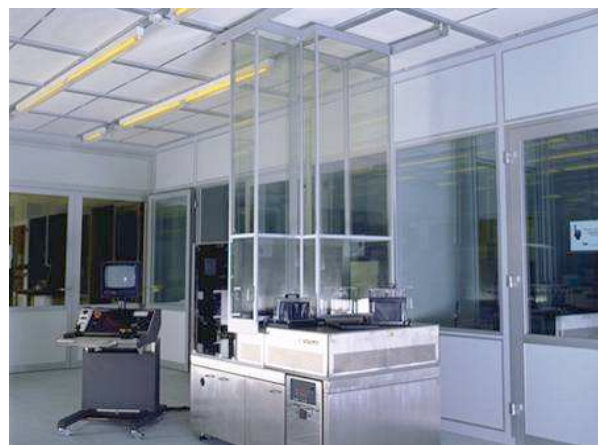
MEVM deckenhängend – MEVM ceiling hang

Dienstleistungen und Geräte für die Reinraumtechnik